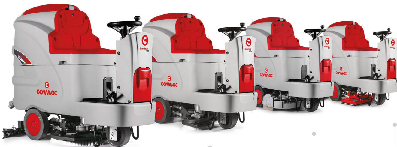
INNOVA 60 Versione con una spazzola a disco